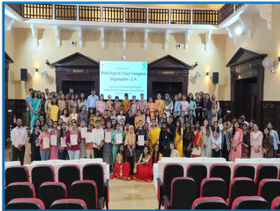
FIGURE 2 Collaborative Initiative between Lucknow University Dept of Psychology and SGP GIMS HQ of SOTTO U.P.to raise Awareness about Organ and Tissue Donation on the Occasion of Indian Organ Donation Day