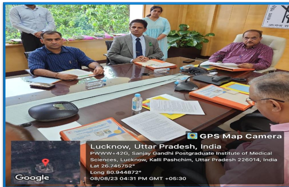
FIGURE 1 Memorandum of Understanding Signing between SGPGIMS and ECHO INDIA.