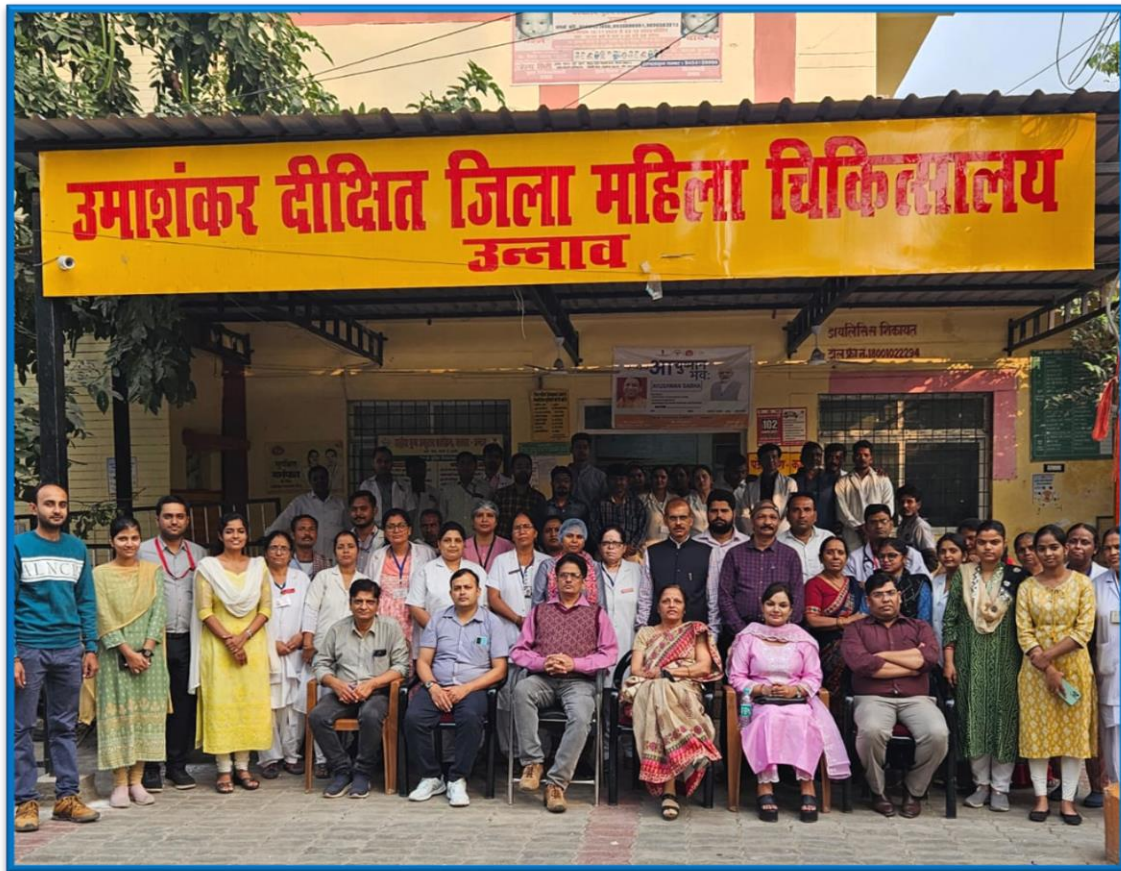
FIGURE 4 Academic Field visit of PG students of Department of Hospital Administration SGPGIMS in Government Hospital Unnao as a collaborative initiative for learning during kayakalp assessment